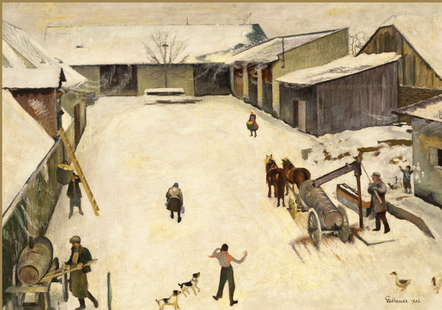
Paul Gebauer, Můj dvůr v zimě, olej na plátně, 1936

Výstava bude veřejnosti přístupná od 22. 1. do 26. 4. 2020 v Historické výstavní budově SZM, Komenského 10, Opava.