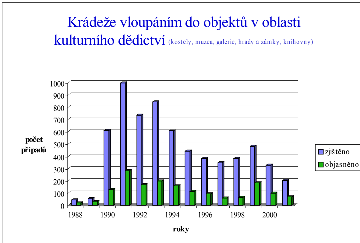
Graf č. 1