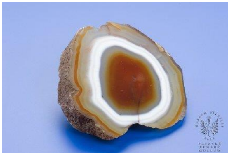
Leštěný achát, lokalita/místo vzniku: Jižní Amerika, Brazílie.

Výstava probíhá od 26. května do 25. října 2020 v Historické výstavní budově, Komenského 10, Opava.