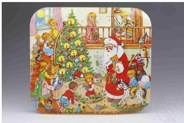
Adventní kalendář pro děti, papírový, barevně tištěný s 24 okénky, uvnitř byla čokoláda různých tvarů. 90. léta 20. století, Nizozemsko, Holandsko. Národní muzeum, Etnografická sbírka

Mezi nejviditelnější znak adventu v dnešní době patří také adventní kalendář s okénky, což je nová tradice pocházející z poloviny 19. století.