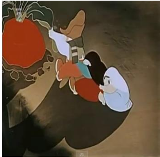
Krátkometrážní pohádku „Zasadil dědek řepu“ natočil Jiří Trnka v roce 1945.

Jiří Trnka byl český výtvarník, loutkař, ilustrátor, malíř, sochař, spisovatel, scenárista, kostýmní výtvarník a režisér animovaných filmů. Narodil se 24. 2. 1912 v Plzni. Zde se seznámil s J. Skupou a jeho loutkovým divadlem, pro které navrhoval kulisy. V roce 1935 absolvoval Uměleckoprůmyslovou školu. Před válkou působil spolu s grafičkou Hermínou Týrlovou ve filmovém studiu firmy Bati ve Zlíně. V roce 1945 se stal jedním ze zakladatelů studia kresleného filmu Bratři v triku. V tomtéž roce získal svou první prestižní cenu v Cannes za film „Zasadil dědek řepu“. V roce 1948 založil Studio Jiřího Trnky, které řídil celých následujících 20 let.