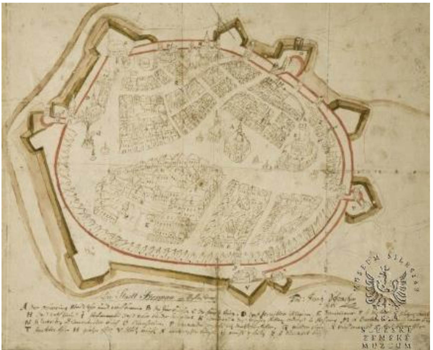
Autor: Ferdinand Franz Schwartzler, datace kolem r. 1700

Zakreslete křížkem do mapy jejich pozice: