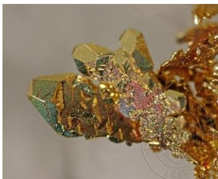
Krystaly zlata v dutině křemenné žilovině. Makrofotografie, velikost 3 mm. Národní muzeum – Přírodovědecké muzeum.

Víte, že kousky zlata se nazývají zlatinky?