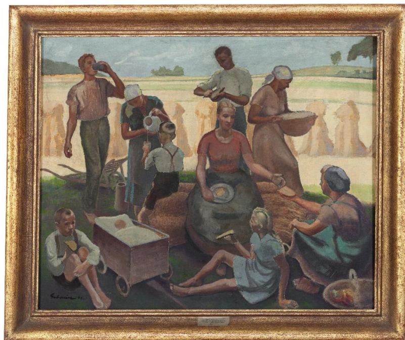
Svačina na poli, 1942

Rurální téma v tvorbě Paula Gebauera znamená ve významu slova venkovské téma, je to zastaralý, knižní výraz, jež se používal k označení směru zabývajících se problémy venkova.