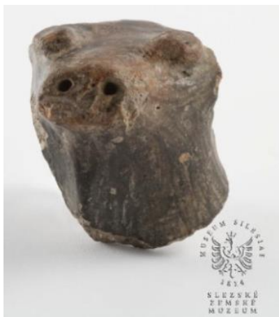
Zlomek zoomorfní plastiky, asi 4. tis. př. n. l.

☆ Lidé též v mladší době kamenné pěstovali obilniny a luštěniny. Napište alespoň dva druhy těchto plodin: