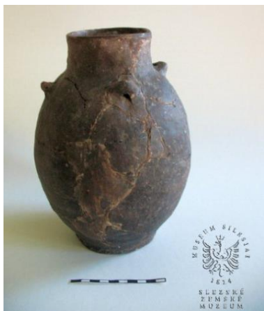
Čtyřuchá amfora s vejčítým tělem, eneolit, pálená hlína.

Na konci doby kamenné se sedimenty (např. jíl) používaly na výrobu hrnců, již v neolitu se objevují hrnčířské kruhy. Vypalování keramiky v peci je známo ale již z paleolitu. Několik inovací v užívání kovů charakterizují pozdější eneolit (doba měděná), na kterou pak navazuje doba bronzová a dále doba železná. Eneolitické období končí s rozvojem zemědělství, domestikací zvířat a tavbou měděné rudy za účelem produkování mědi. Období se také říká prehistorie, protože lidé ještě neuměli psát – což je tradiční začátek historie (to jest zaznamenaná historie). K zavedení písma došlo na Blízkém východě ve 4. tisíciletí př. n. l..