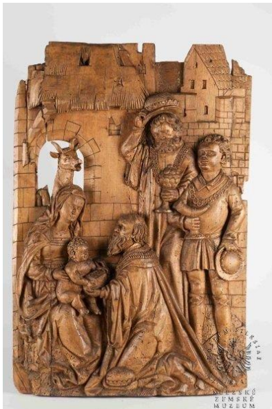
Klanění Tří králů, kolem roku 1520, dřevořezba, lipové dřevo

Svátek Zjevení Páně čili Epifanie, lidově zvaný svátek "Tří králů", je svým obsahem téměř totožný s vánočním svátkem Narození Páně. Svátek "Tří králů" klade důraz na něco trochu jiného. Společné mají to, že se Bůh zjevuje jako člověk, dokonce jako narozené dítě.