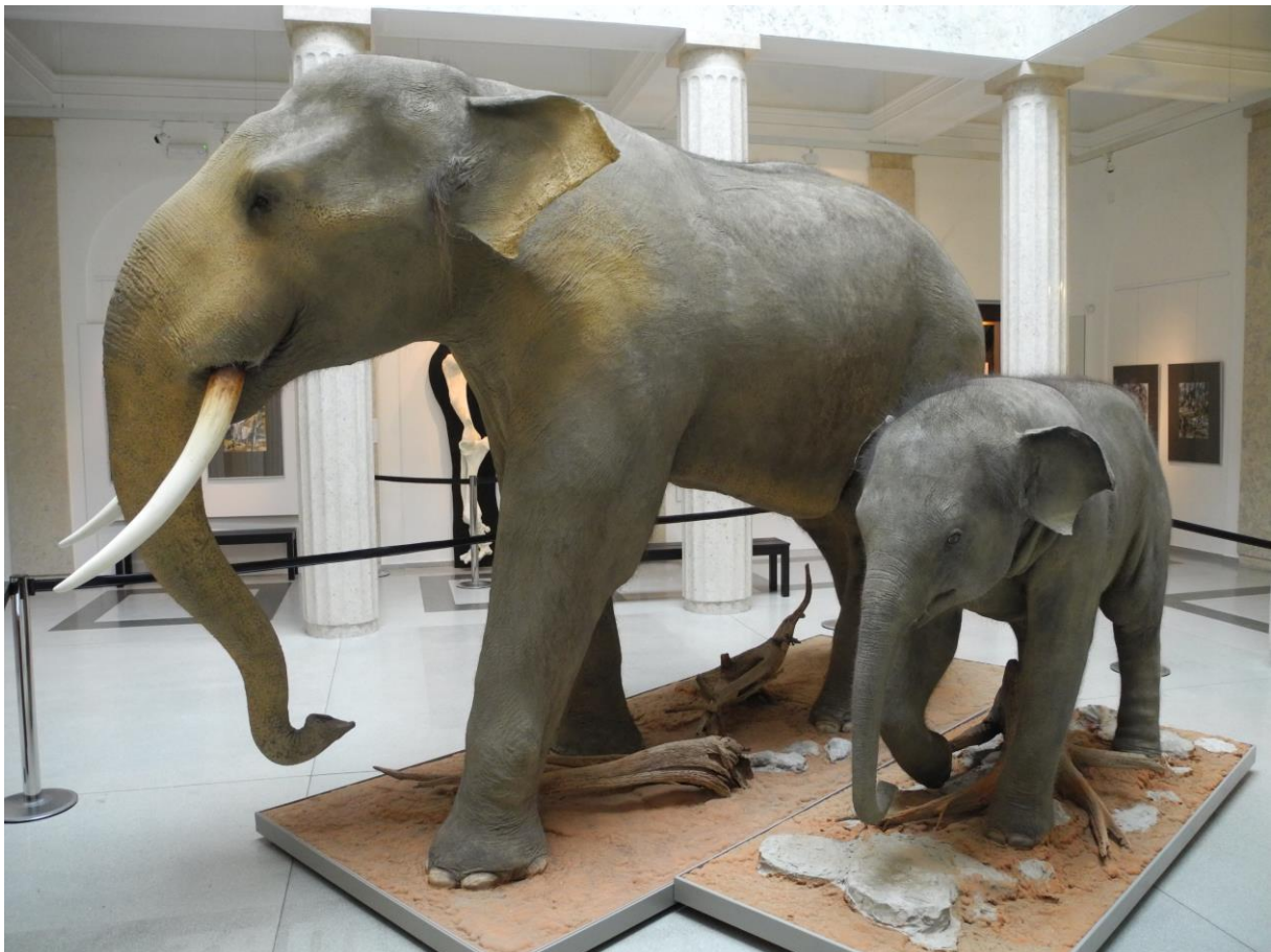
Calvin a Sumitra

Slon Calvin, jehož preparát je od konce roku 2016 k vidění v Historické výstavní budově Slezského zemského muzea, je bezpochyby nepřehlédnutelným exponátem. Ostravská zoologická zahrada darovala muzeu také kůži po předčasně uhynulé mladé samičce Sumitře. Pojdme se podívat blíže na tyto slony s naším pracovním listem.