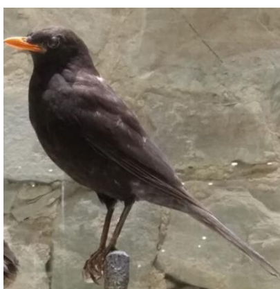
Exponát kose černého