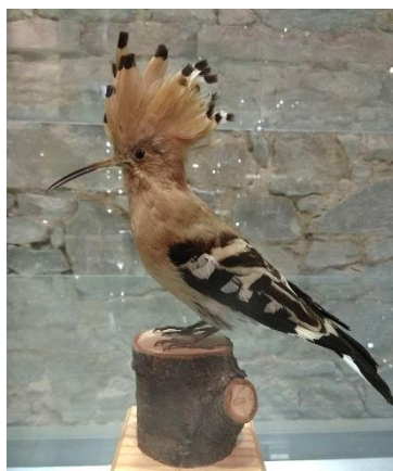
Exponát dudka chocholatého