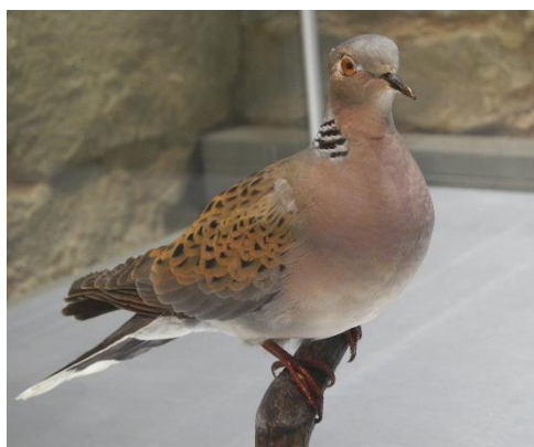
Exponát hrdličky zahradní