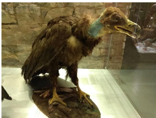
Exponát supy hnědé

Vybrané obrázky exponátů, které se nacházejí ve Slezském zemském muzeu.