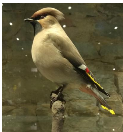
Exponát brkoslava severního