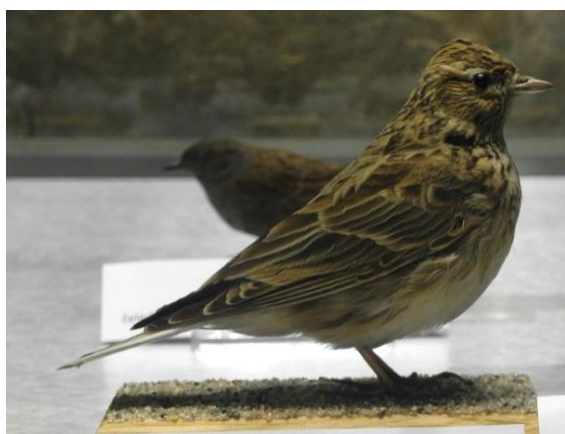
Exponát skřivana polního