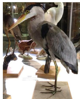
Exponát volavky popelavé