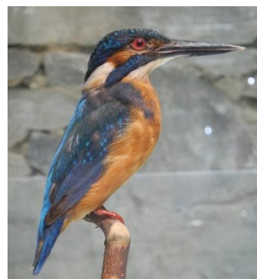
Exponát ledňáčka říčního