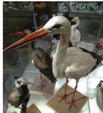
Exponát čápa bílého